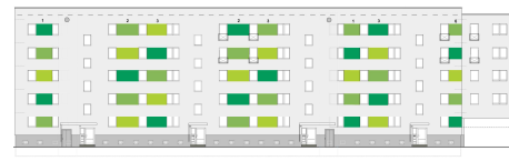
Stollenansicht Straße der Jugend 1:120 Meter