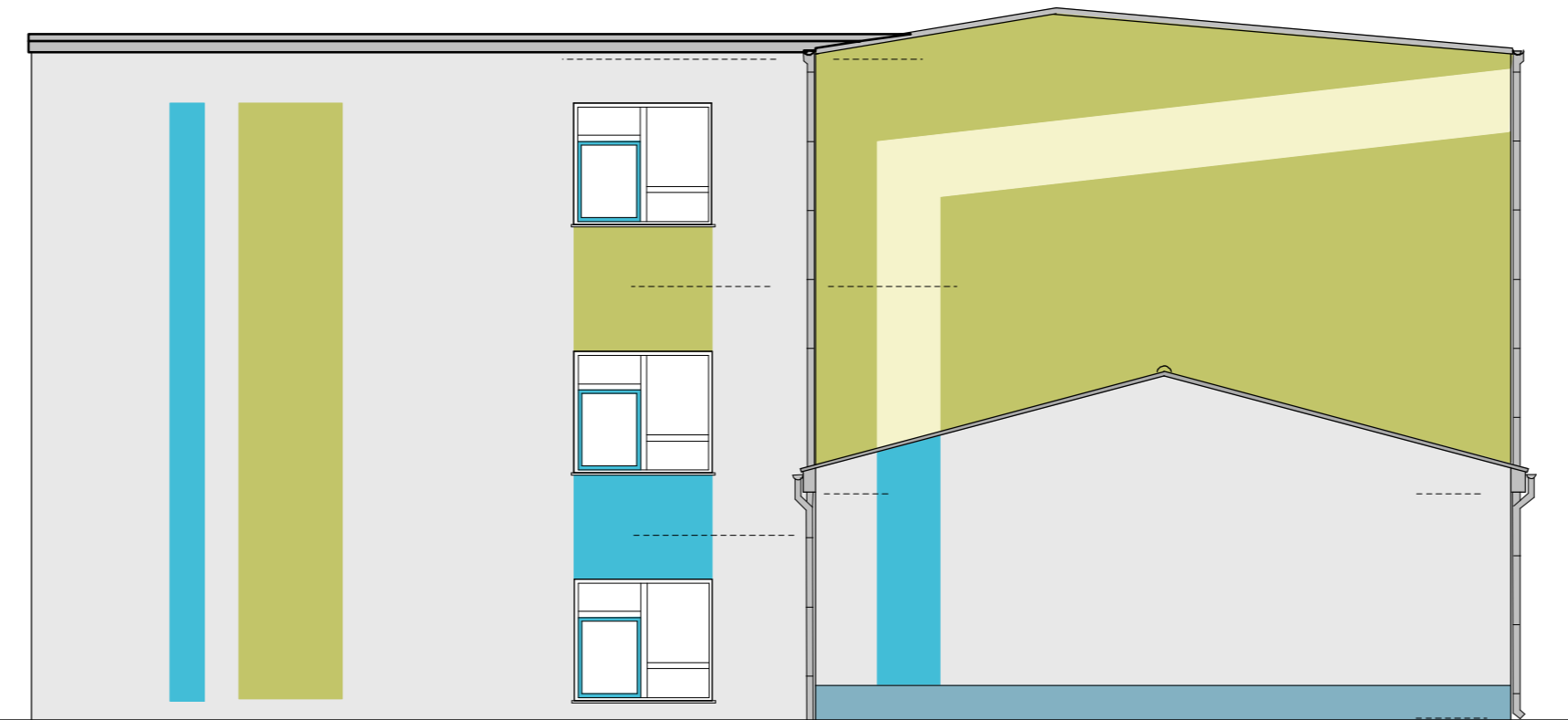
Ansicht von Nord - Ost