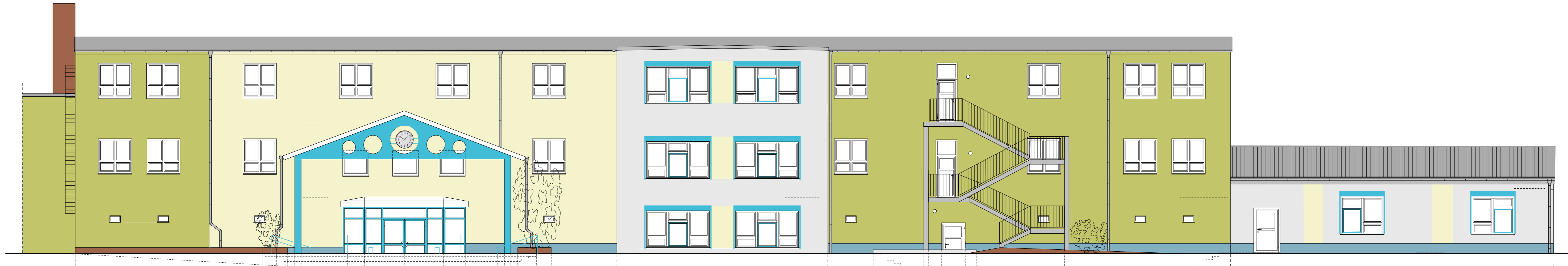
Schulhofansicht von Süd - Ost