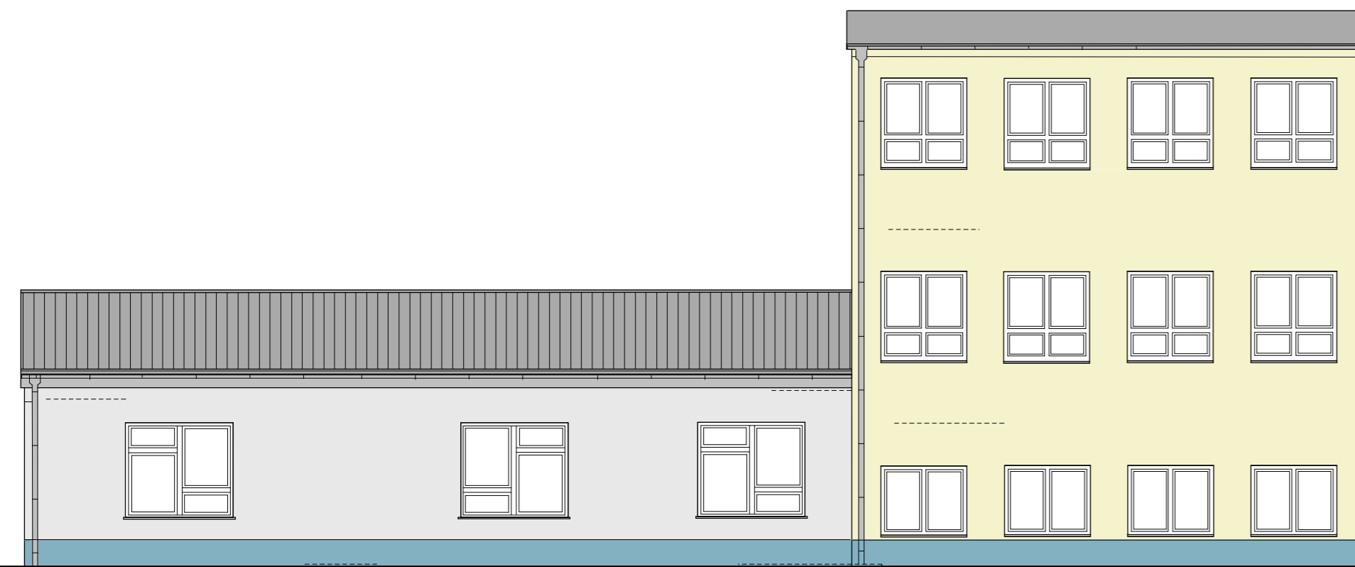
Teilansicht von Nord - West